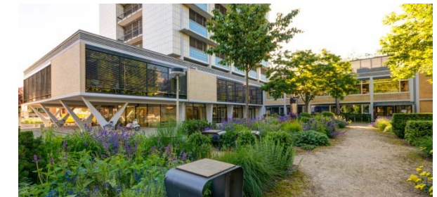
„Garten der Physik“

Dieser Bereich umfasst klassische Quantentheorie komplexer Systeme zusammen mit experimenteller Polymerphysik, Nano-Magnetismus und Biophysik. Insbesondere in der angewandten Forschung existiert eine ausgeprägte Kooperation mit Instituten der Fraunhofer-Gesellschaft und anderen Fakultäten.